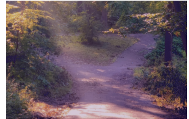
Bilder von Cathrin

Selbstbewusst, herzlich, mystisch stilisiert